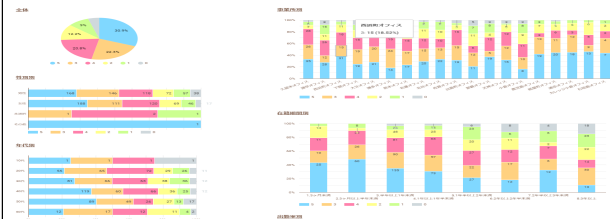
就労意欲アンケートを3月より取得開始した。今後定数観測し、測定を行う